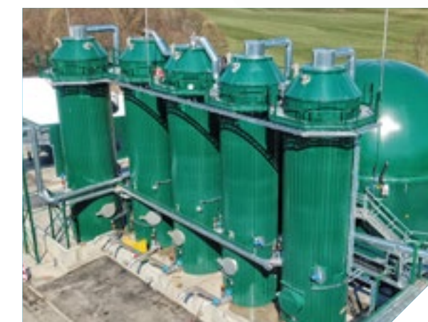
BioPV - Digestión anaerobia de la fase líquida extraída de residuos orgánicos