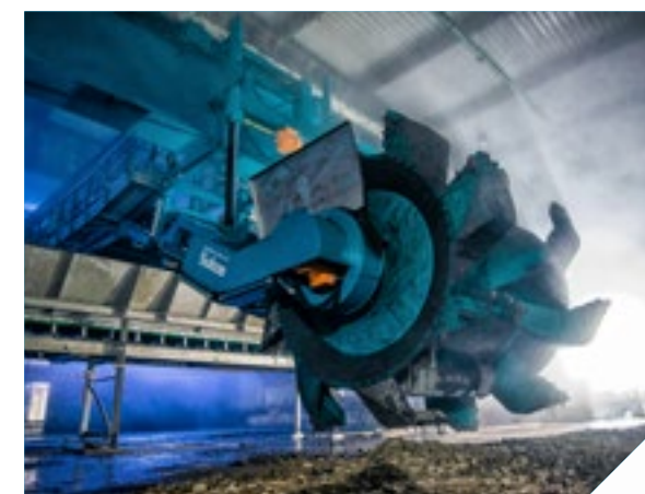
Wendelin - Compostaje mediante volteadora de puente

Digestión anaerobia de la fase líquida extraída de residuos orgánicos