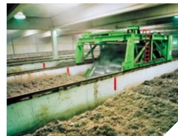
BioFIX - Compostaje en hileras