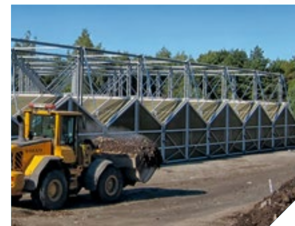
BIODEGMA® - Tecnología de membranas